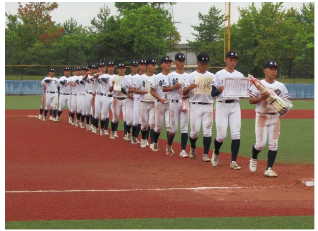
準優勝 日本航空石川