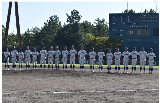
第三位 金沢学院大学附属