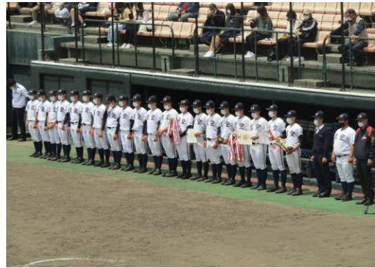
準優勝 日本航空石川